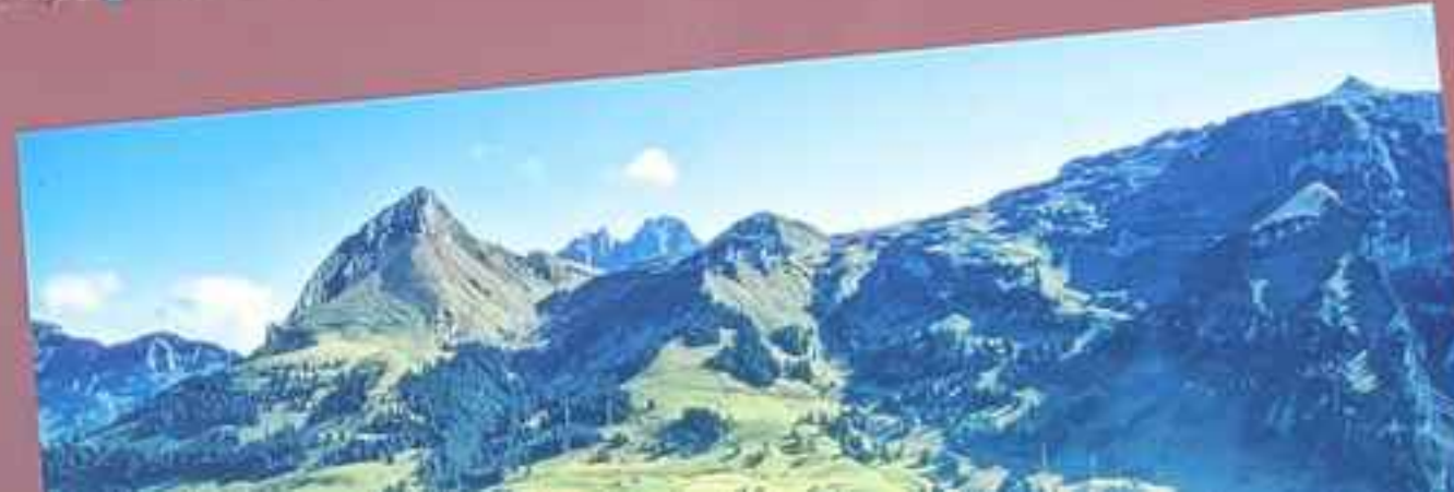
(im Hintergrund), Schiit