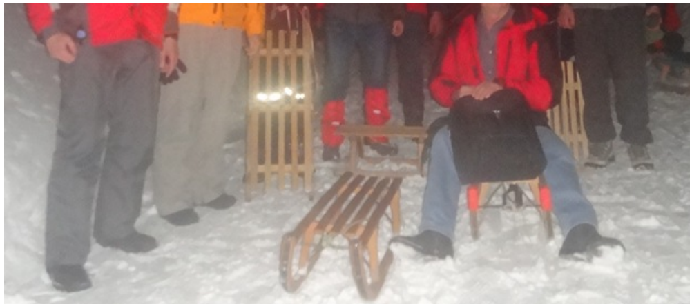
2013-02-14 Schlitteln am Bachtel