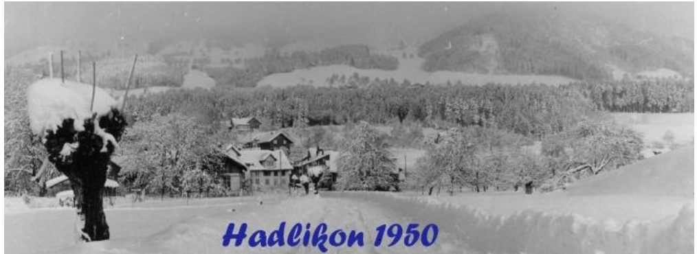
<anklicken für weitere Bilder>